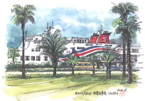
新居浜東港 マリンパーク 2003年