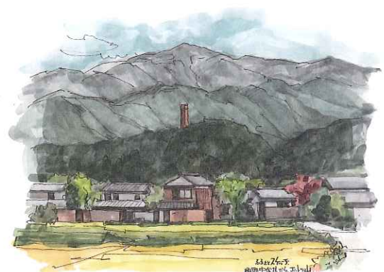
角野中学校から煙突山