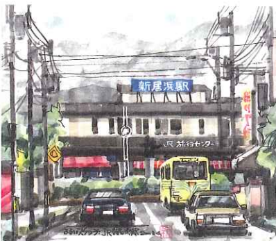
JR 新居浜駅 2003年