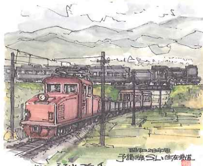
昭和28年頃予讃線SLと住友鉄道 1999年