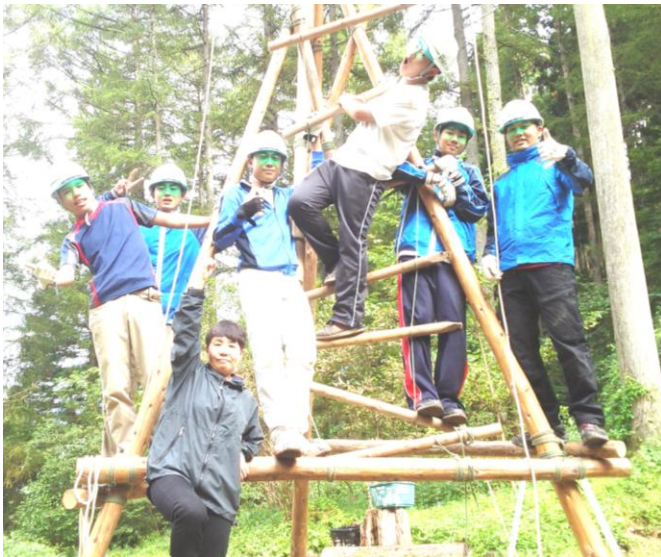
それぞれの技術とチームワークを発揮できた！