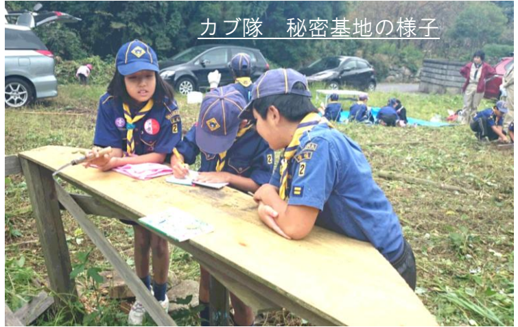
カブ隊 秘密基地の様子